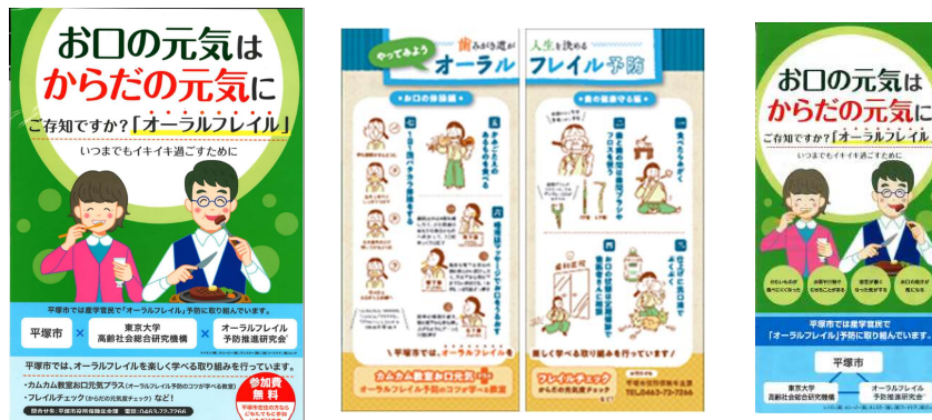
図 2. サンスター作成のオーラルフレイル啓発物

参考) 下記ウェブサイトにて一般向けオーラルフレイルリーフレット掲載。(上記は平塚市版)