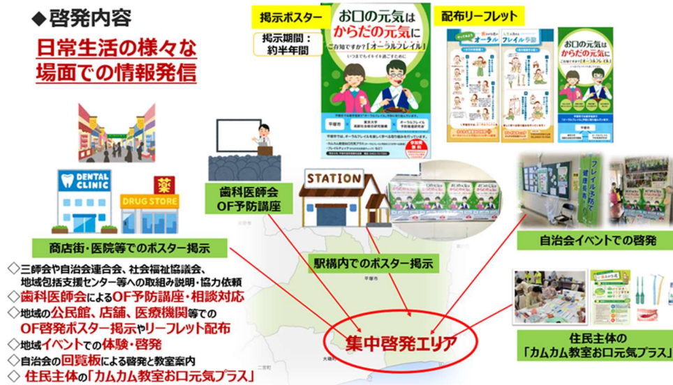
図 1. 平塚市内でのオーラルフレイルに関する集中啓発