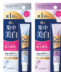
オーラツー プレミアム クレンジングペースト [プレミアムミント] / [アロマティックミント]

ステイン除去成分(清掃剤)を高濃度配合。週に 1 回の特別なケアで、普段のハミガキでは落としにくい頑固な着色汚れやニオイのもとをすっきり落とします。