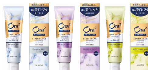
オーラツー プレミアム ステインクリアペースト [プレミアムミント] / [アロマティックミント] / [シャイニーシトラスミント]