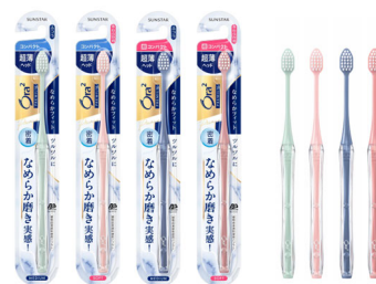
オーラツー プレミアム ハブラシなめらかフィット [コンパクト(ふつう・やわらかめ)] [超コンパクト(ふつう・やわらかめ)]

オーラツー史上最薄ヘッドで奥まで届きやすく、スタイリッシュなデザインで、なめらかなみが心地とツルツルなみがきあがりを実感できます。国内市販ハブラシとして初めてバイオマスプラ(BP)マーク認証を取得しています。