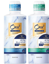
オーラツー プレミアム マウスウォッシュ ダブルクレンジング [リフレッシュクリアミント] / [フレッシュフローラルミント]

独自処方で口臭の原因菌を瞬間殺菌し、着色汚れの元を洗い流すだけでなく歯につきにくくするコーティング機能で、口臭と着色汚れの元を W クレンジングします。