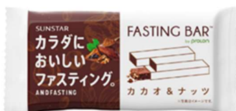
カラダに美味しいファスティング(カカオ&ナッツ味)

<リリース> https://jp.sunstar.com/notice/press_release/20240424_007161.html