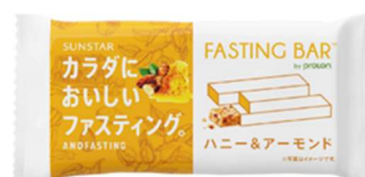
(ハニー&アーモンド味)