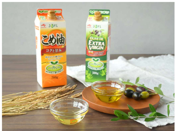
J-オイルミルズ「スマートグリーンパック®」シリーズ

https://jp.sunstar.com/health-food/kenkodojo/product_005.html