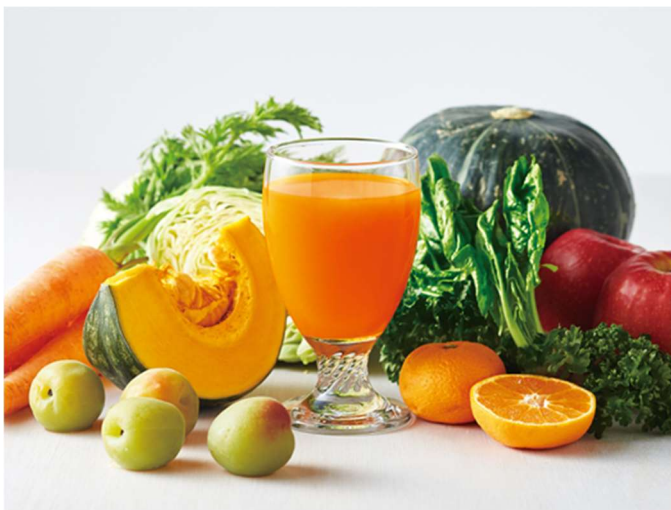
健康道場 黄実野菜