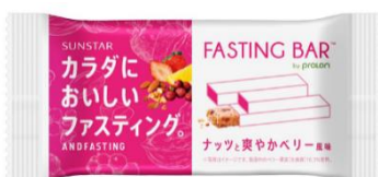
【新商品】 ナッツと爽やかベリー風味