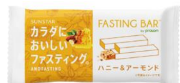
ハニー&アーモンド味