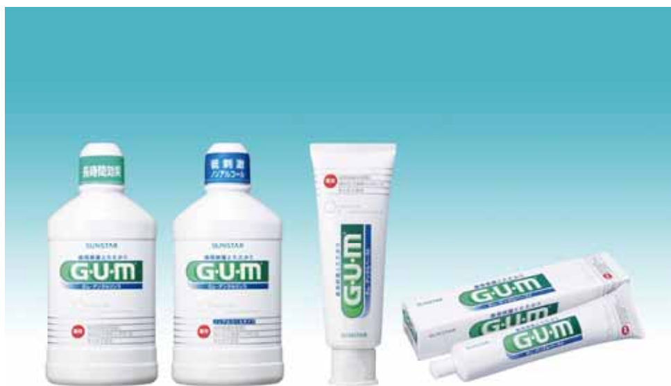
G・U・M デンタルペースト、デンタルリンス

サンスター株式会社は、歯周病（歯肉炎・歯周炎の総称）予防のトップブランド G・U・M（ガム）シリーズより、最新の歯周医学に基づく先進機能で、歯周病菌の殺菌だけでなく、歯周病菌が出す毒素（LPS）もまとめて除去する「G・U・Mデンタルペースト」と「G・U・Mデンタルリンス」を、9月1日（木）より全国で改良新発売します。