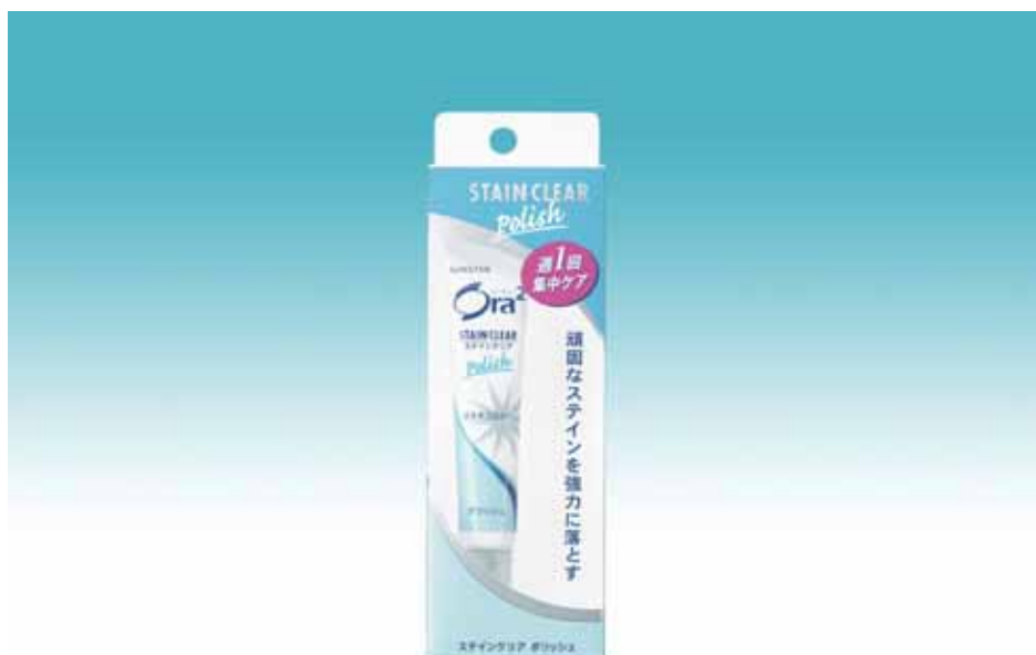
Ora 2 ステインクリア ポリッシュ