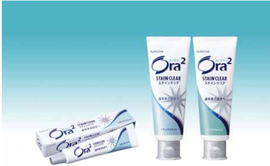
Ora 2 ステインクリア ペースト