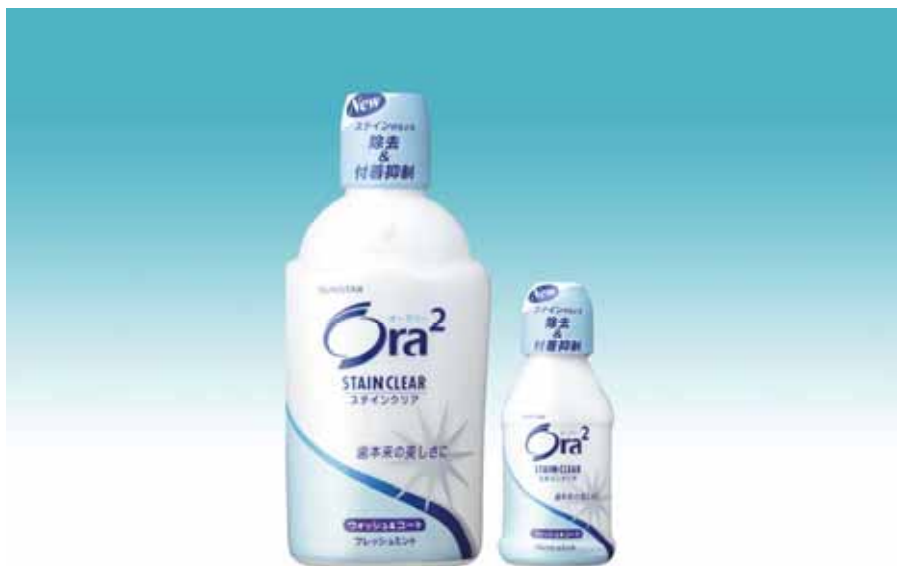
Ora 2 ステインクリア ウォッシュ&コート