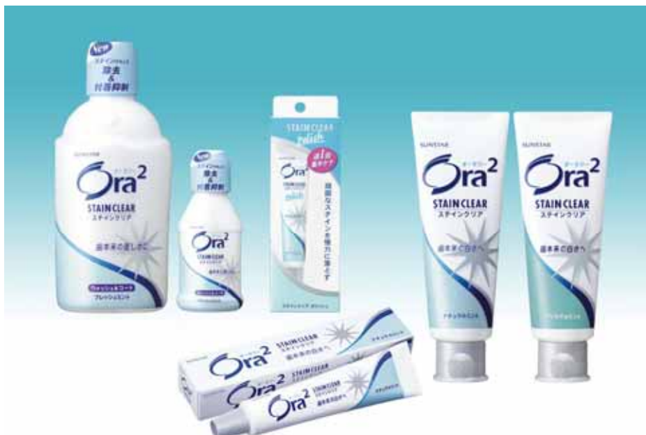
Ora 2 ステインクリアシリーズ

また、ステインコントロール成分の泡を改良した「Ora 2 ステインクリアペースト」を8月上旬より改良新発売します。