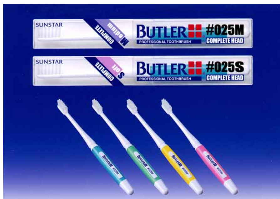
バトラーハブラシ#025M / #025S

サンスター株式会社では、革新的な無平線植毛技術により実現した、狭くみがきにくい部位にもスムーズに毛先が届く超薄型ハブラシ「バトラーハブラシ#025M / #025S」を、4月18日(月)より全国の歯科医院へ向けて新発売します。