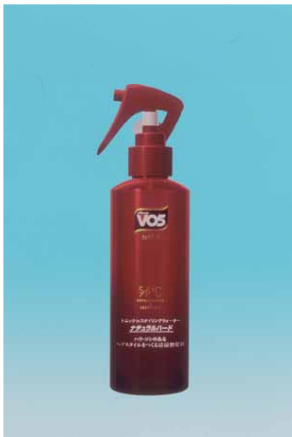
VO5 for MEN トニック in スタイリングウォーター

サンスター株式会社では、スタイリング剤のセット力とヘアトニックの頭皮清浄・爽快感の両立を実現した男性用清涼整髪剤「VO5 for MEN トニック in スタイリングウォーター (ナチュラルハード)」を3月7日(月)より全国で新発売します。