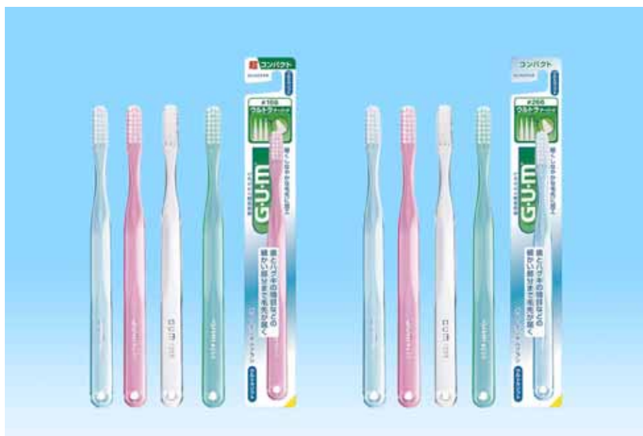
G・U・M デンタルブラシ#166 / #266

サンスター株式会社では、歯周病菌とたたかう G・U・M (ガム) シリーズより、サンスターが新たに開発した新フィラメント<ウルトラテーパード毛>を採用した「G・U・M デンタルブラシ#166 (超コンパクト)」と「G・U・M デンタルブラシ#266 (コンパクト)」を、2月21日(月)より全国で新発売します。