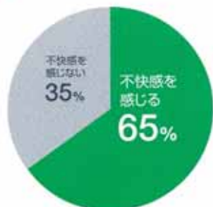
DATA 起床時、お口の不快感の実感

当社の調査では、65%の人が、朝、お口の中に不快感があるのは、当たり前だと思っています。実際、寝ている間は、だ液の分泌量が低下し、歯周病・口臭などの原因菌が繁殖しやすくなり、翌朝の不快感を引き起こします。