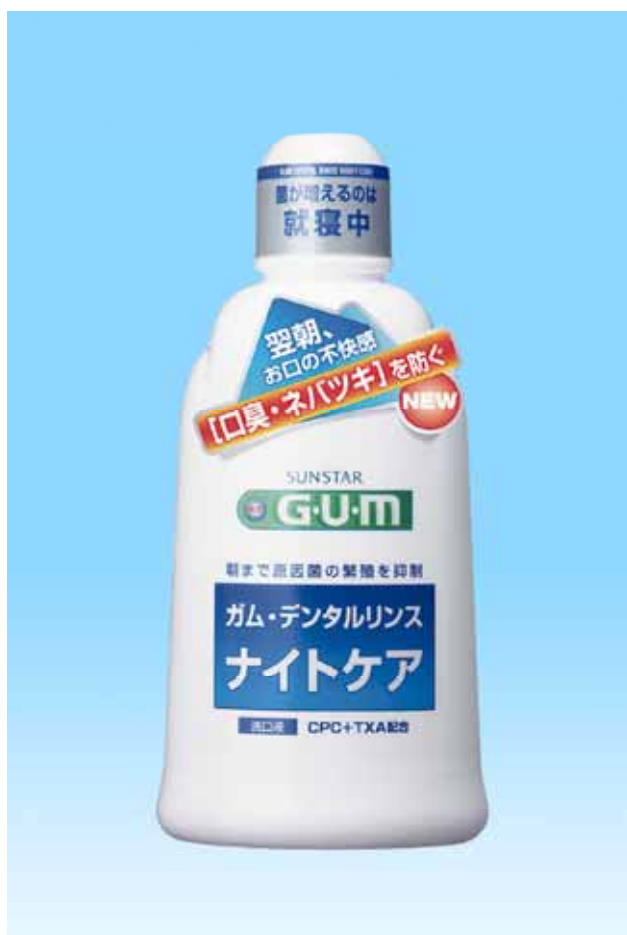
G・U・M デンタルリンスナイトケア

サンスター株式会社では、歯周病菌とたたかう G・U・M (ガム) シリーズより、おやすみ前に使用し、翌朝のお口の不快感 (口臭・ネバツキ) を防ぐ洗口液「G・U・M デンタルリンス ナイトケア」を、2月21日 (月) より全国で新発売します。