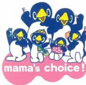
新キャラクター ペンギンファミリー

ペンギンキャラクターをDoクリアこどもシリーズのメッセンジャーに起用し、こどもと一緒に楽しみながら正しいオーラルケアを啓発します。