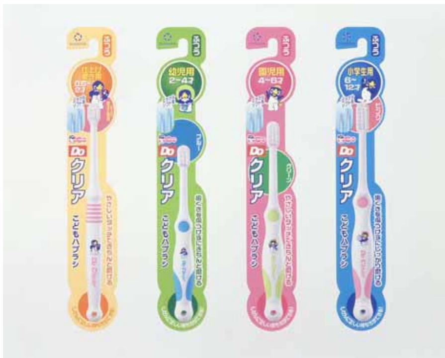
Doクリアこどもハブラシ

「Doクリアこどもハブラシ」は、こども達のブラッシング行動を分析し、持つ位置が定まらない、しっかり握れない、持ち替えしづらい、ブラッシングの力をコントロールできない、などの課題を解決するために、こどもの手や口の大きさを実測し、人間生活工学に基づいたヘッド&ハンドル設計を採用しています。また、ハグキにやさしいミラクルソフト毛が、歯垢をしっかり除去します。