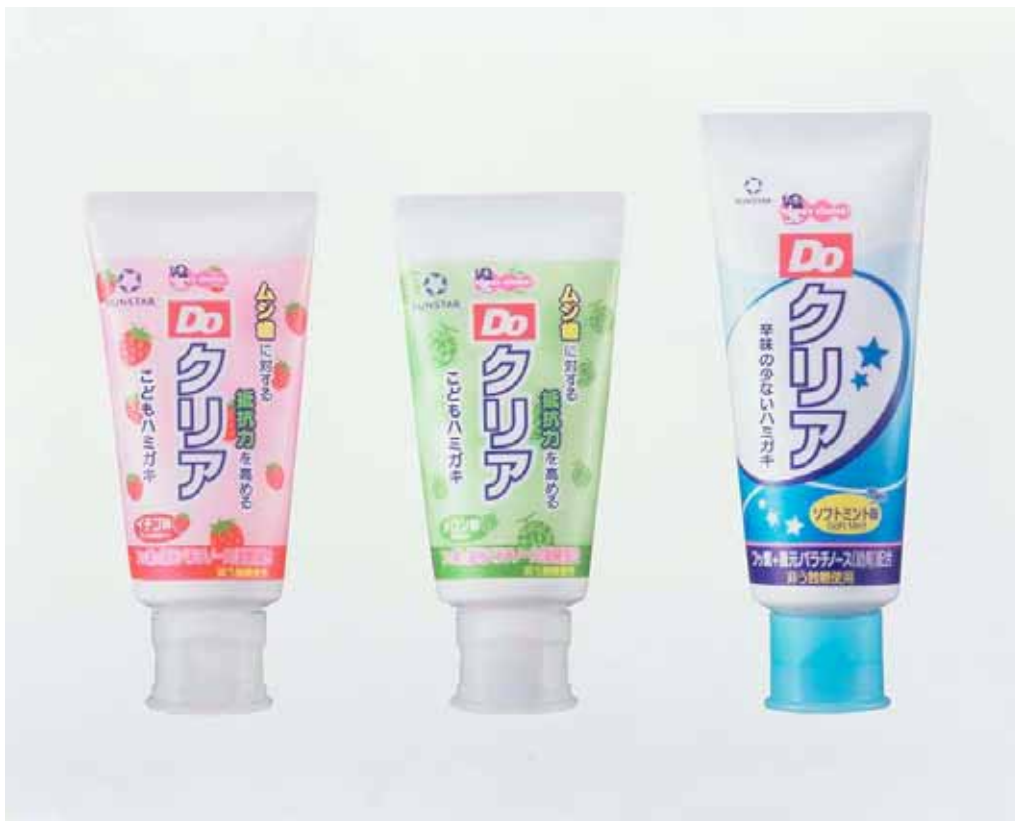
Doクリアこどもハミガキ

「Doクリアこどもハミガキ」は、フッ素と還元パラチノース（助剤）を配合。ムシ歯に対する抵抗力を高めます。また、こども達のブラッシング行動を分析し、フタの開閉がしにくい、力が弱いのでしぼり出しにくい、チューブ口が大きくてハブラシにうまくのせられない、などの課題を解決し香味やチューブに独自のアイデアを取り入れています。