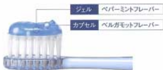
○エッセンスinペーストのフレーバー構造