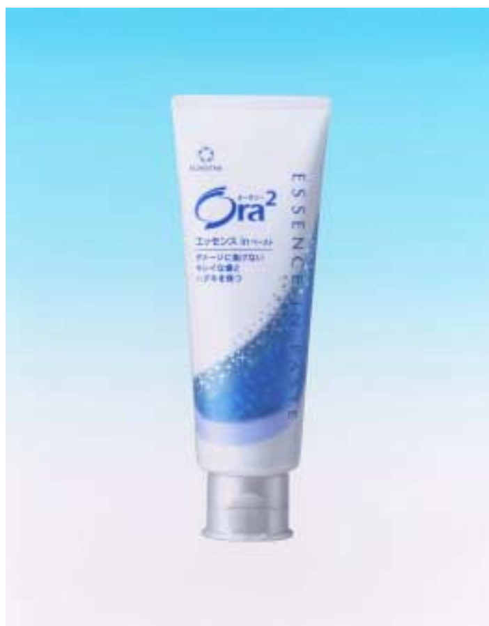
Ora 2 エッセンスインペースト

サンスター株式会社では、美しさのためのエッセンス、ビタミン E やハーブカプセル (香味剤)などを配合し、与えるケアで歯とハグキを毎日のダメージから守る薬用ハミガキ「Ora 2 (オーラツー) エッセンスインペースト」を8月23日(月)より全国で新発売します。