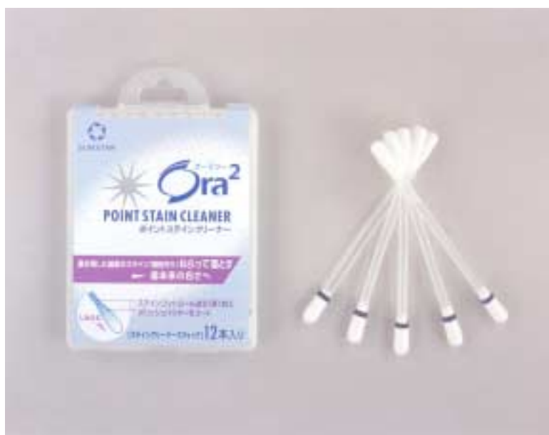
Ora 2 ポイントステインクリーナー

サンスター株式会社では、みがき残した歯の表面のステイン（着色汚れ）をねらって落とす新しい形状のニューアイテム「Ora 2 （オーラツー）ポイントステインクリーナー」を2月20日（金）より全国で新発売します。