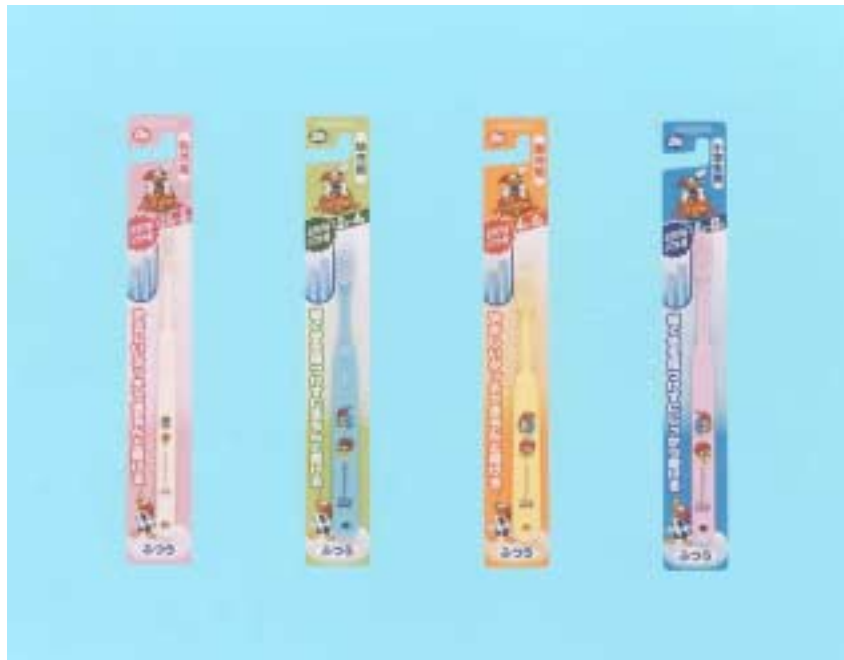
ドゥー こどもウッドペッカー

サンスター株式会社では、こども用ハブラシ「ドゥー こどもウッドペッカー」の毛先を新開発の「ミラクルソフト毛」に改良し、4月25日(金)より全国で改良新発売します。