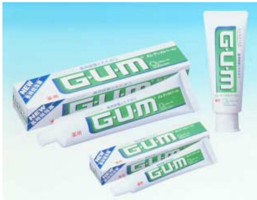
G・U・M デンタルペースト

今回の処方改良では、殺菌剤 CPC(塩化セチルピリジニウム)の歯面への吸着力を強化するだけでなく、歯周病菌の繁殖を長時間抑制する効果を高め、より効果的に歯周病（歯肉炎・歯周炎）を予防します。