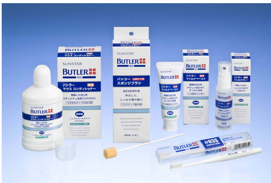
バトラー 口腔ケアシリーズ

サンスター株式会社（本社：大阪府高槻市、代表取締役社長：濱田和生）では、口腔乾燥や口腔粘膜の荒れた方向けに、乾燥した口の中を保湿する商品と、弱った口腔粘膜を刺激しにくいケア商品を揃えた「バトラー 口腔ケアシリーズ」を2009年6月24日（水）より、静岡県立静岡がんセンター、静岡県内の主な歯科医院で販売を開始します。今後は、順次、全国の病院売店での販売を拡大してまいります。