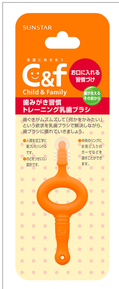
C & F 歯みがき習慣 トレーニング乳歯ブラシ