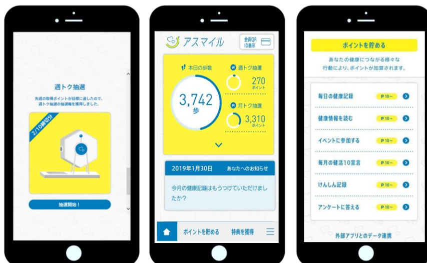
アスマイル画面イメージ

サンスターは今後も、オーラルケアから始まる健康づくりによる健康寿命の延伸への貢献を目指し、口腔ケアの重要性を広く啓発するとともに実践を促す、新たな製品・サービスとソリューションを提供してまいります。