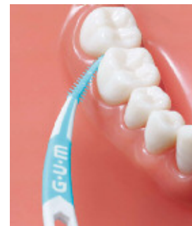
奥歯にも届きやすいカーブ型ハンドル