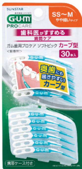
ガム歯周プロケア ソフトピックカーブ型 30P サイズ SS~M