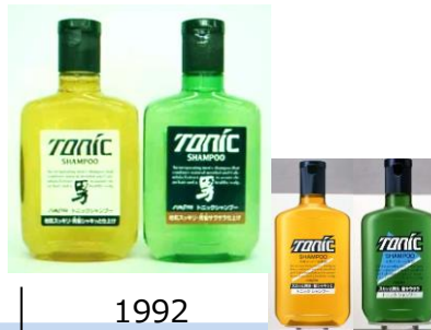
男髪シャキッと仕上げ（左）/ 男髪サラサラ仕上げ（右）

リンスインシャンプーの先駆け 長めの髪が流行りだしたこともあり、髪のかしみに着目。当時まだ珍しかったリンスインシャンプーを開発。