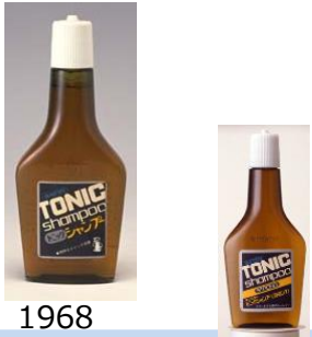
初代サンスタートニック シャンプー