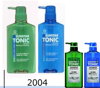
スカルプケア（左）/ リンスイン（右）

リンスインをラインナップ 時代の流れにより、髪のかしみの洗いがりを重視。しっとりした洗い上がりへ。透明なリンスインシャンプーが登場。