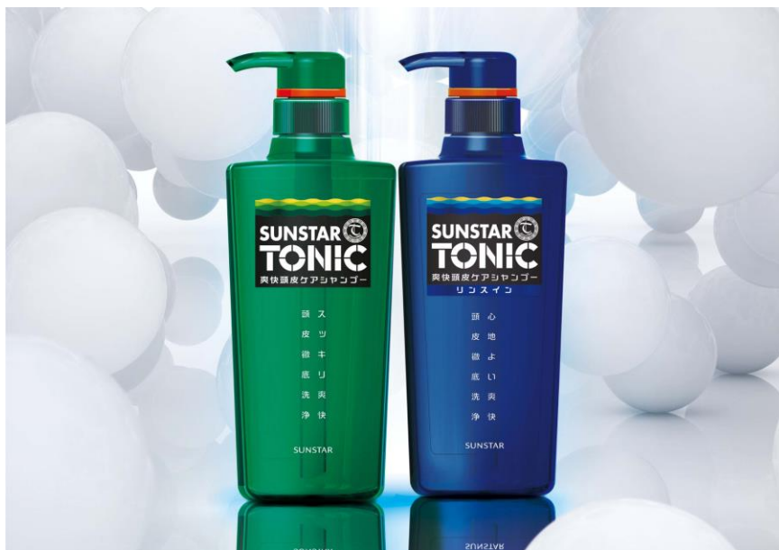
サンスタートニック爽快頭皮ケアシャンプー（左） サンスタートニック爽快頭皮ケアシャンプー リンスインタイプ（右）

※1 サンスターでは、皮脂に含まれる不飽和脂肪酸の中でも、炭素数が16以上の長鎖不飽和脂肪酸を「ベタツキ原因皮脂」と呼んでいます。代表的なものにオレイン酸、エイコセン酸など。