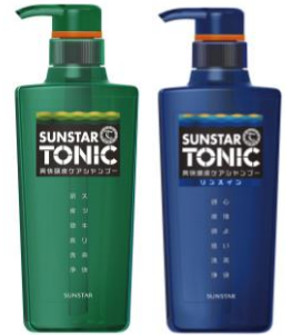
爽快頭皮ケアシャンプー/ 爽快頭皮ケアシャンプー リンスイン

男性の内面にも着目 ストレス社会に負けない、がんばる男性を応援するブランドへ。清涼感の持続性、頭皮の皮脂除去力を大幅アップ。