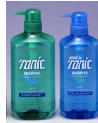
サラサラ（左）/ リンスイン（右）

それまでのイメージを一新 爽やかな男性が好まれるようになり、香りを爽やかに、デザインも一新。清涼感そのままにサラサラに仕上がる処方を開発。