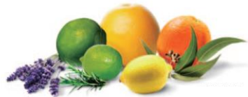
(香りのイメージ図)

外国の香水をイメージした香りから始まり、爽やかなフレッシュグリーンフローラル調、より爽快感を感じるシトラスハーブ調の香りへと時代に合わせて香りも変化させてきました。