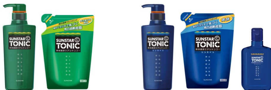
サンスタートニック 爽快頭皮ケアシャンプー 480mL(左)／詰替え用 360mL(右)

爽快頭皮ケアシャンプー リンスインタイプの使用感：クリーミーな泡で洗髪時の髪のきしみ感を防ぎ、サラサラの仕上がりに。