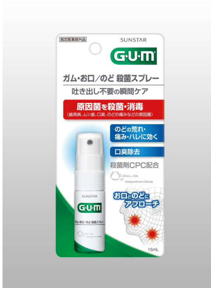
ガム・お口／のど 殺菌スプレー