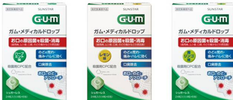
ガム・メディカルドロップ

大人(15歳以上)及び5歳以上の小児：1回2粒1日3~6回。1粒ずつ2粒までを口中に含み、かまずにゆっくり溶かして使用する。2時間以上の間隔をおいて使用する。